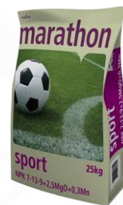
Marathon Sport 7-13-9

Melspring International B.V. Arnhemsestraatweg 8 6881 NG Velp