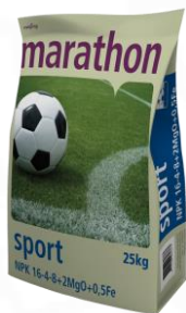
Marathon Sport 16-4-8