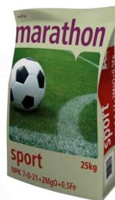
Marathon Sport 7-0-21